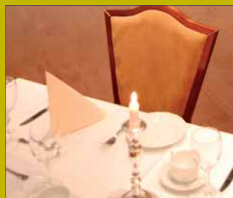
Nyt et deilig måltid i vår restaurant "Fru Lucie" med utsikt over havet.

Fakta: Ørland Kysthotell ligger helt i sjøkanten på Brekstad havn. Hotellet som ble oppført i 1998 er handicapvennlig med blant annet heis til alle etasjer