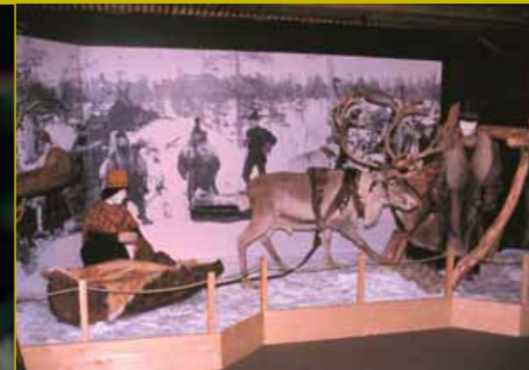
Bo godt og opplev Snåsa sammen med andre!