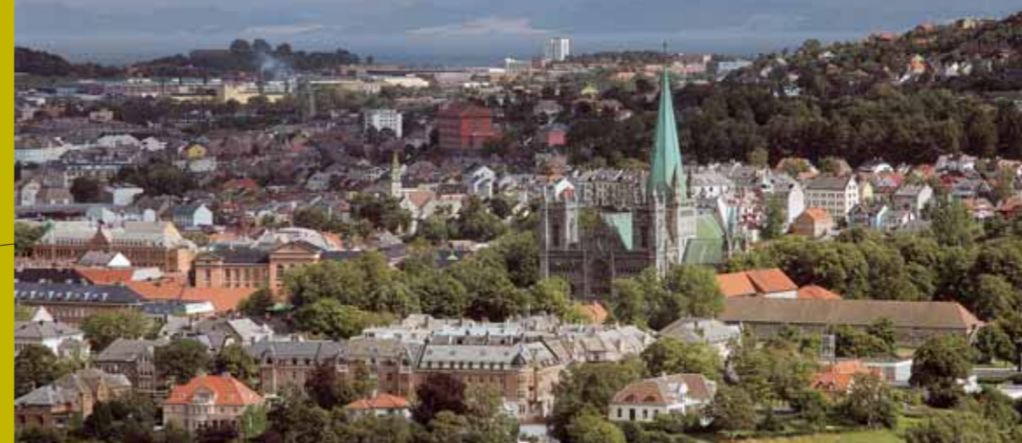
På tur til Trondheim og Nidaros-domen sammen med flere!